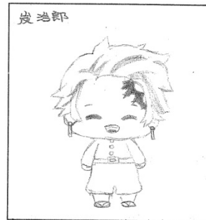
畫出理想朋友模樣(可參考動漫人物)