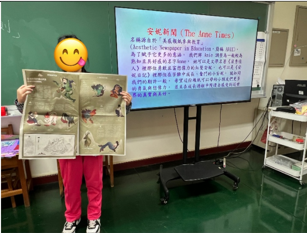
學生帶領介紹自己最喜歡的主題