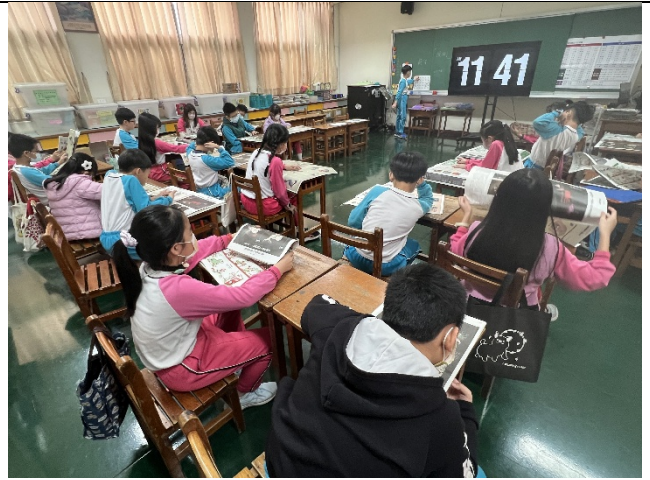
全班聚精會神地在讀安妮新聞報紙