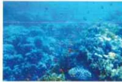
地點: 不知道 組成物件: 海、珊瑚、小魚 色畫 (由深到淺/可分色系/暖色系寒色系) 海廢連結: https://oceantrash.rethinkw.org/