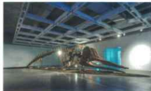
藝術家: 林純用 作品名稱: 蟹魚骨架身後的海洋危機 作品材料: 木頭、釘子、架子、繩子 作品尺寸: 直徑7米 圓周21米 展覽名稱: 黑湧