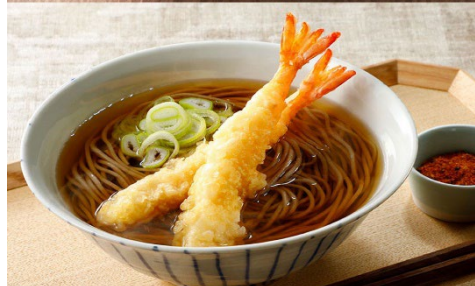
高中前定居在日本的學生介紹