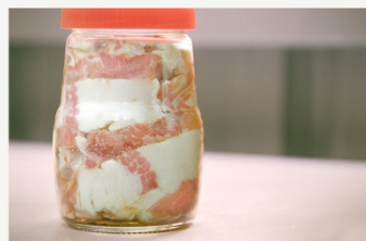
阿美族同學對 siraw 的深刻印象