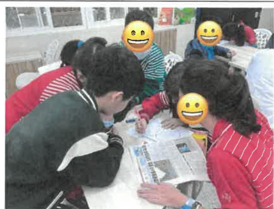
安妮新聞與國語日報范氏圖比較