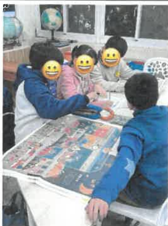
安妮新聞與國語日報范氏圖比較