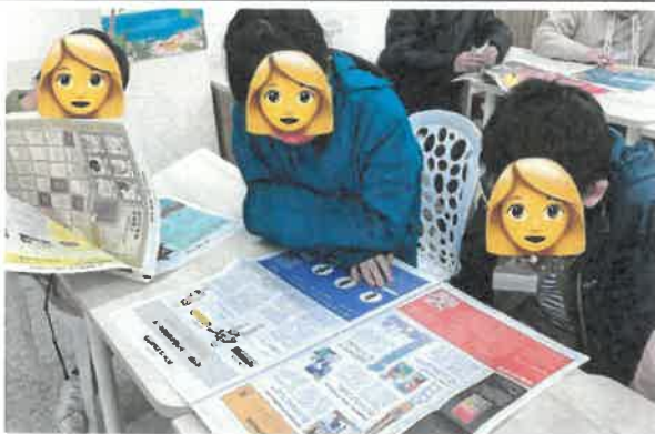
安妮新聞報紙閱讀