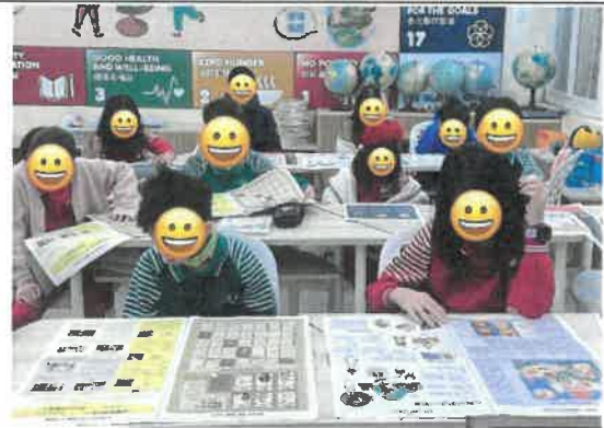
安妮新聞報紙閱讀