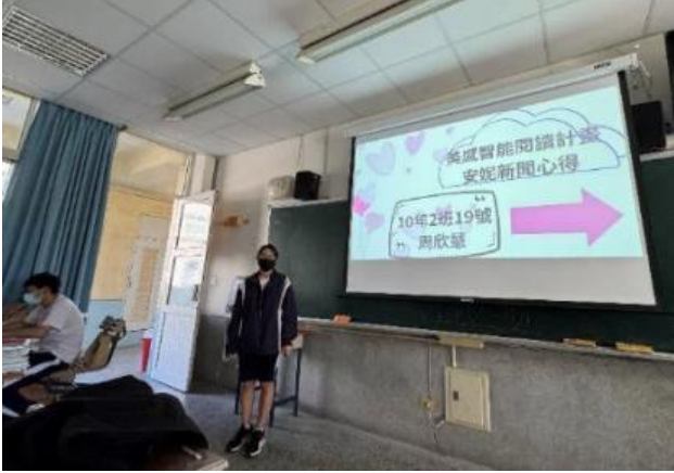
同學主動幫播簡報，讓發表學生專心講述。