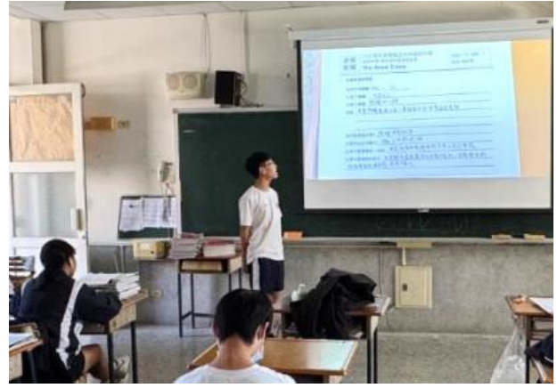
學生侃侃而談自己書寫的學習單內容。