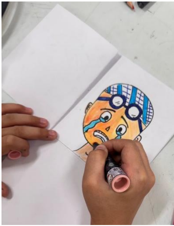
學生創作翻翻書內頁的四種不同情緒頭像。