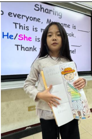
學生上台自己編寫的心情故事。