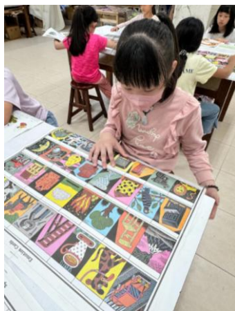
學生閱讀第十期安妮新聞