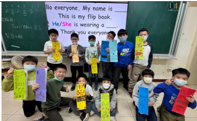
學生一起分享完成的翻翻書作品。