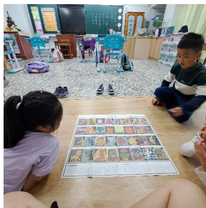
Emotion Cards-看圖說情緒 ( 一 )