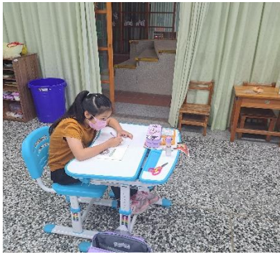
基本情緒圖鑑-書寫 ( 二 )