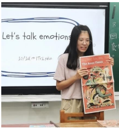
安妮新聞讀報初體驗 ( 一 )