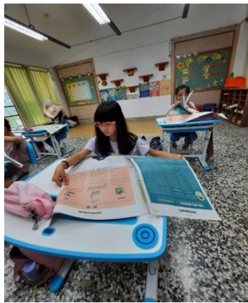
安妮新聞讀報初體驗 ( 二 )