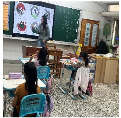
認識基本情緒圖鑑 ( 一 )