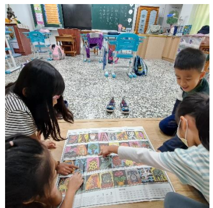
Emotion Cards-看圖說情緒 ( 二 )