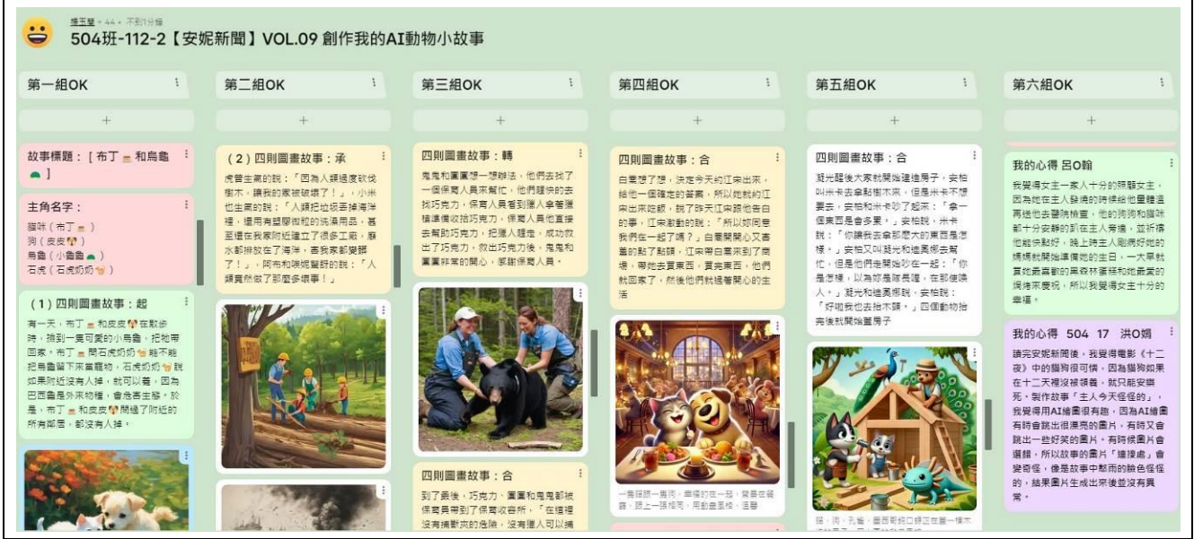
↑502、504 班小組成員在 Padlet 上創作 AI 動物小故事，運用 AI 工具繪製插圖。

針對整個學習活動，每人寫心得150字。 (17) 校園會出現流浪貓狗以外，走在馬路上也會經常看到，著無家可歸的流浪貓狗，沒有屋頂給他們遮風避雨，沒有人供他們三餐，真的很可憐。我們看了其實很有感覺，因為這就是每天發生在我們身邊的問題，我們覺得更應該要去瞭解流浪貓狗的相關知識，要有辦法思考如何解決校園中或社會裡流浪貓狗的問題，也希望透過我們的研究夠將流浪貓狗的相關知識宣傳出去，讓高年級學童真正懂得如何愛護動物等。