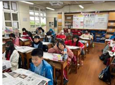
05.同學自主閱讀報紙