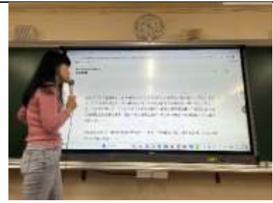
06.使用安妮新聞網站