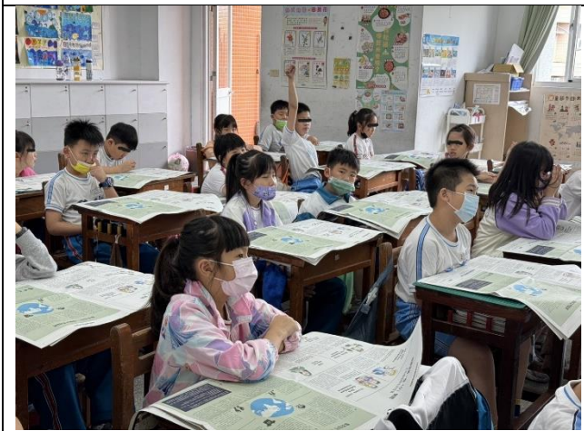
食衣住行:環保入門指南