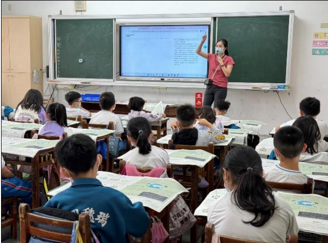
介紹安妮新聞內容