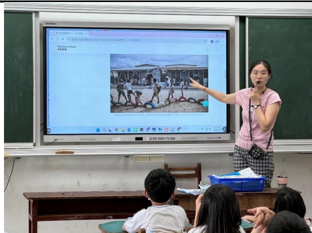
用垃圾蓋學校 - 一次一個塑膠磚