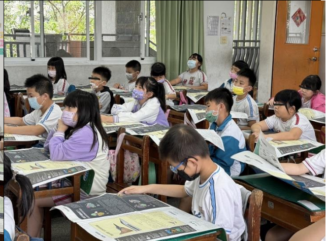
地球不堪負荷了! 四項過度消耗的自然資源