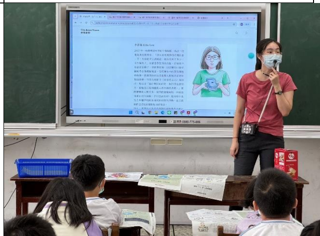
改變世界從「小」做起五名環保學生的故事