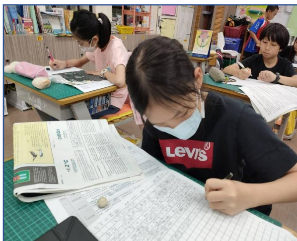
將報紙上的資訊轉化為寫作的材料