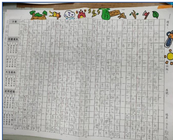
讀文章寫看法(事理說明文)