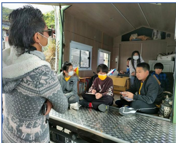
用行動保護地球-透過訪問了解移工需求