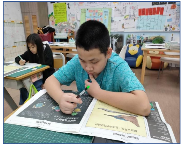
仔細閱讀自己有興趣的篇幅