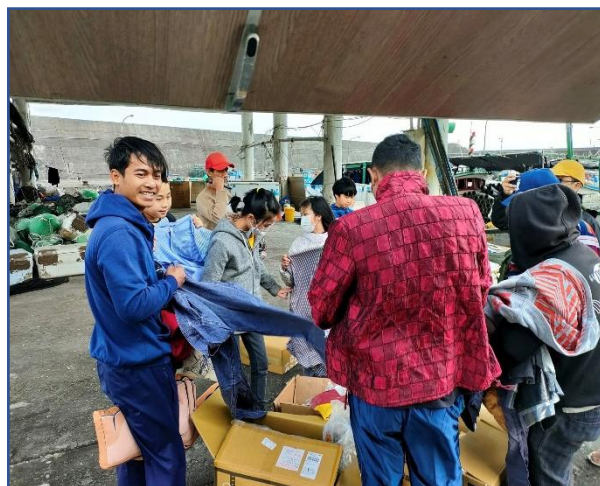
用行動保護地球-學生送物資給東南亞移工