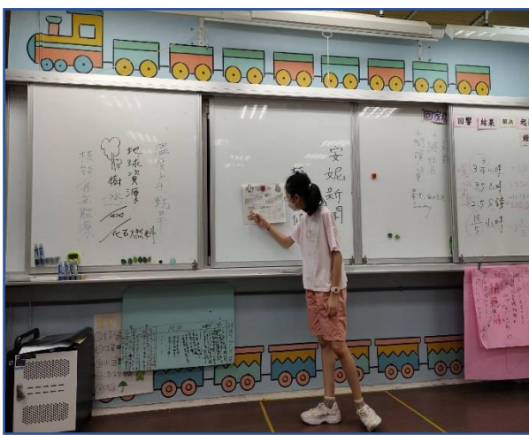
討論及分享安妮新聞上的資訊