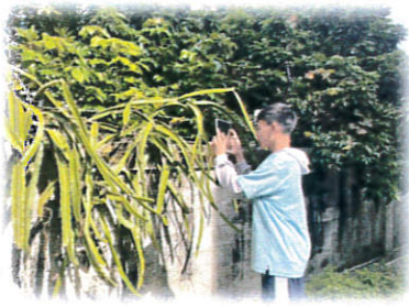
尋找校園可食植物-生存的秘訣