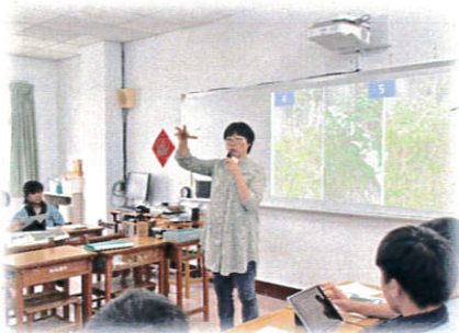
校園可食植物-生存的秘訣