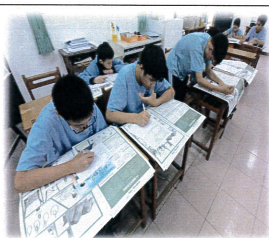
學生讀報-10 個生存秘訣