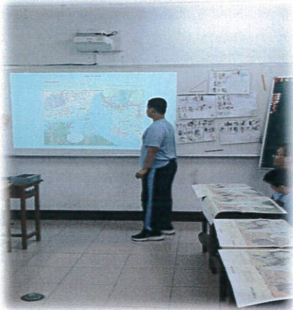
小組分享-前進的可能