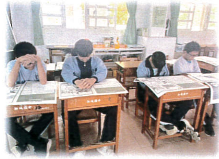
冥想小練習-生存的秘訣