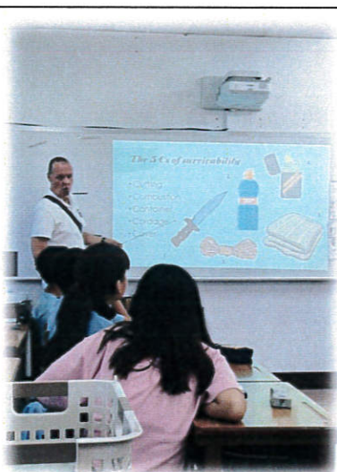
外師協同教學引起動機-生存的秘訣