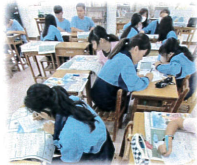
小組討論-生存的秘訣