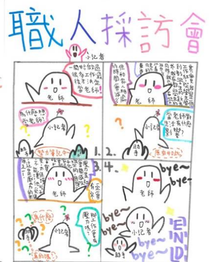
▲學生的採訪報導生動豐富