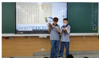
▲▼透過課文分享及 讀報教育，學習並筆記 採訪要點及技巧。