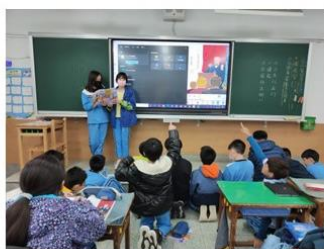
▲▼課文分享及查找 機智名人資料