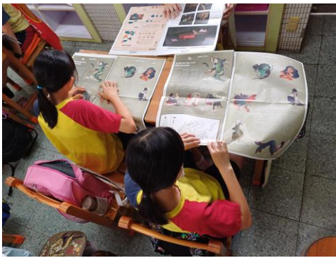
小組分析與討論妖獸是源於哪些未知的事物