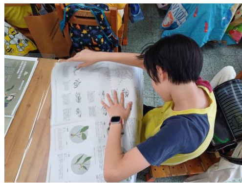
學生研究紙本報紙特色