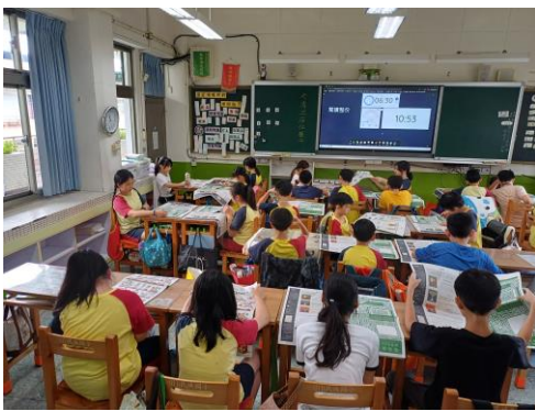
老師帶領全班共讀夏日特刊