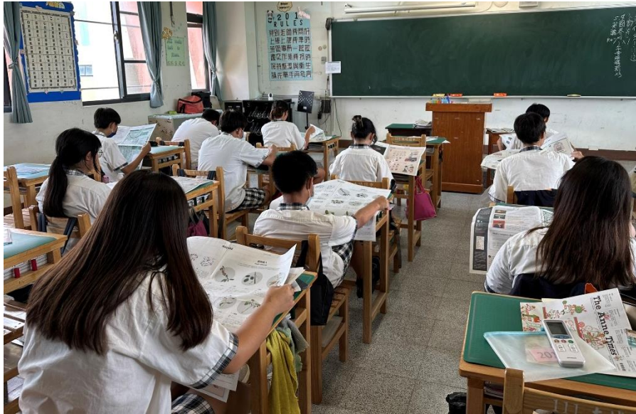
閱讀課帶領學生閱讀 夏季特刊