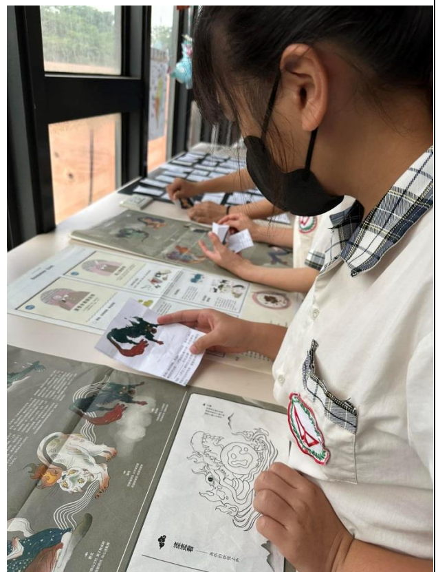
搭配主題書展，讓學生進行閱讀闖關活動