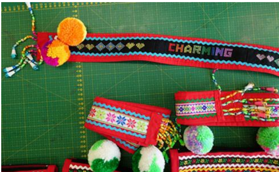
教師示範情人背帶(延伸作業未列入評量)