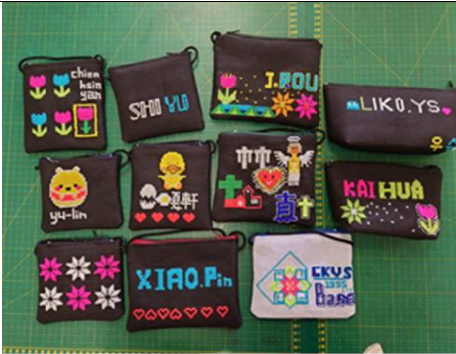
學生作品(最後決定製作成隨身小包及筆袋)