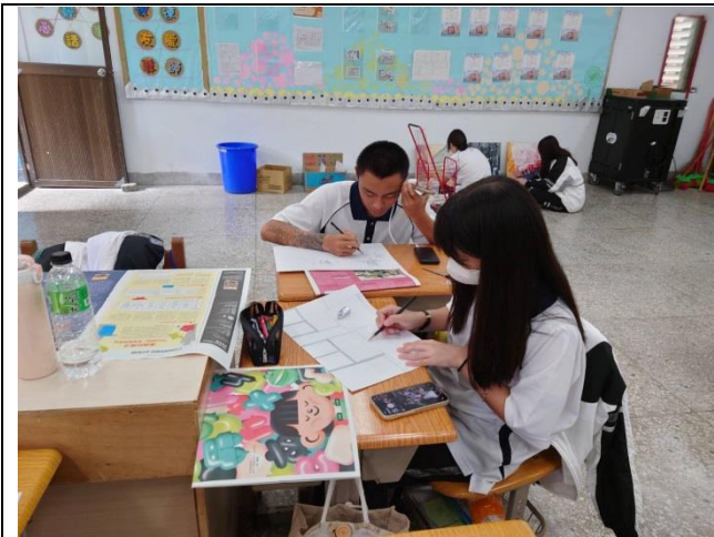
學生讀報、討論並收集資料