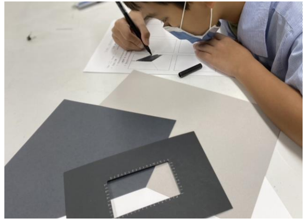
↑ 學習單 2—黑白灰比例練習