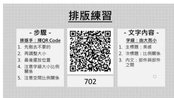
↑ 小組運用 Jamboard 做排版練習