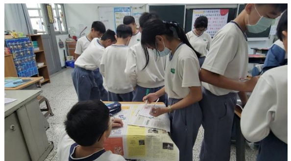
周哈里窗活動透過別人認識自己