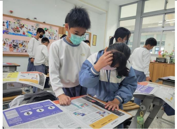
彼此分享安妮新聞中的金氏紀錄