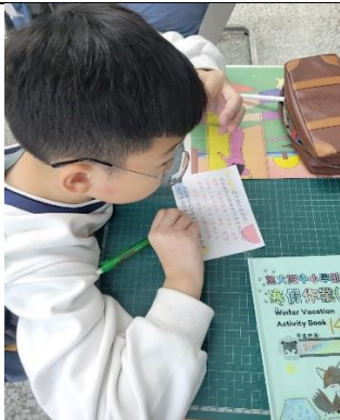
周哈里窗活動自己認識自己