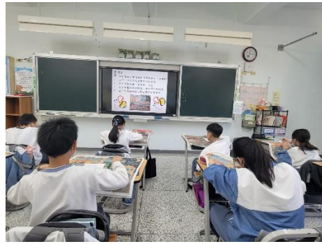
夢想公寓認識職業