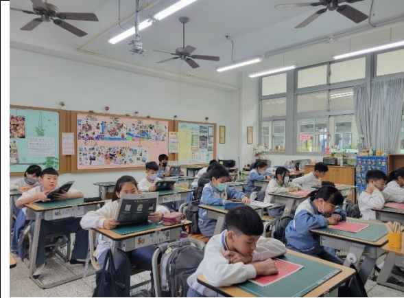
全班一起閱讀安妮新聞