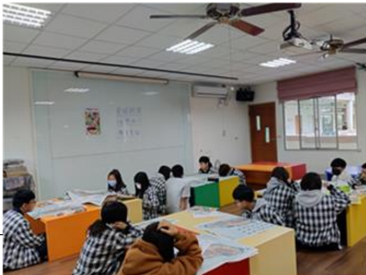
05 學生一起聆聽 【聲音素描一】 5