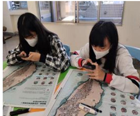
03-04 圖 第一節課 【認識台灣聲音地圖】學生使用手機、平板聆聽地圖上的收音