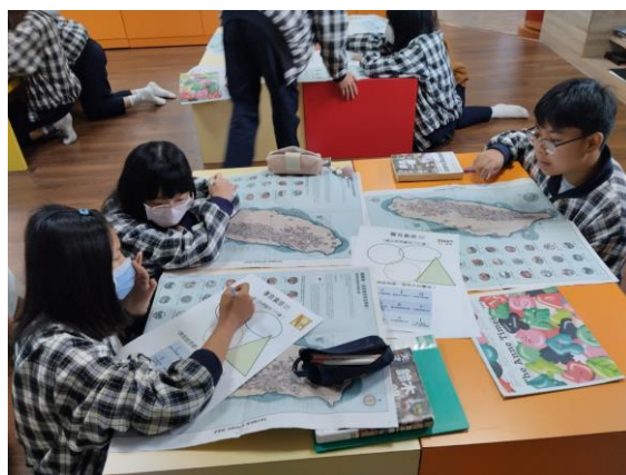
08 學生 進行聲音素描