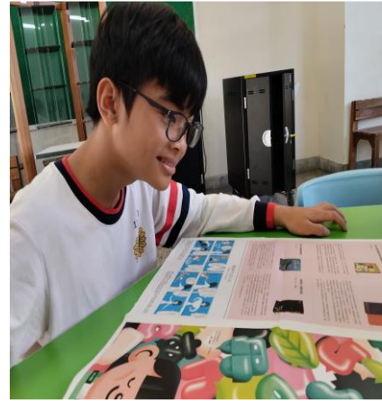
01-02 圖 第一節課 【認識台灣聲音地圖】 學生瀏覽【安妮新聞聆聽特刊】