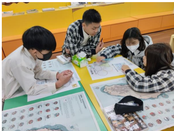
07 學生 聲音素描 討論地點