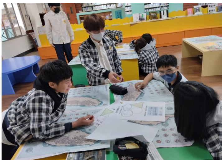
06 學生討論 【聲音素描一】你聽見了什麼？