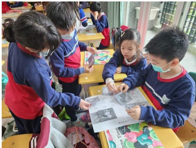
小組討論區辨情緒表情與動作