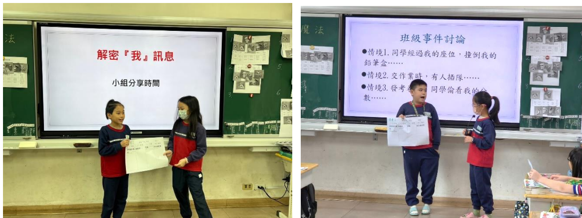
解密「『我』訊息」上臺分享