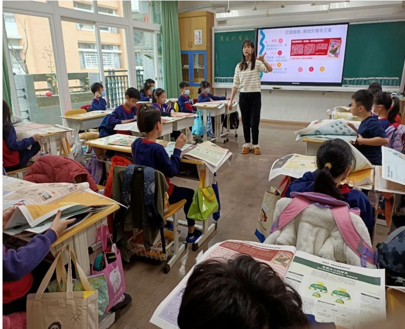
結合舊經驗，介紹報紙的元素