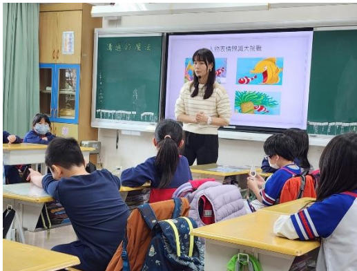
練習情緒辨識與小組呈現