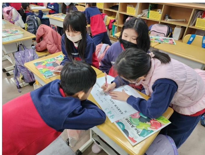
「『我』訊息」的小組討論與練習