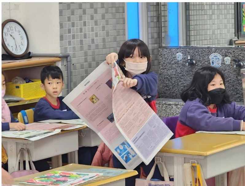
學生發表觀察安妮新聞所得