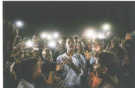
一個男生在被私閱。