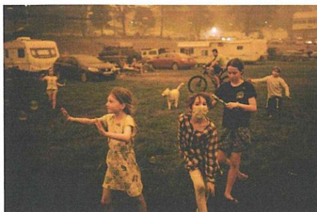
一羣人在公園玩泡泡。