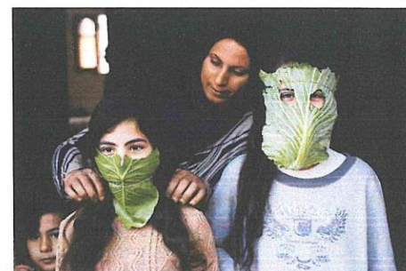
一些人在做葉子面具。