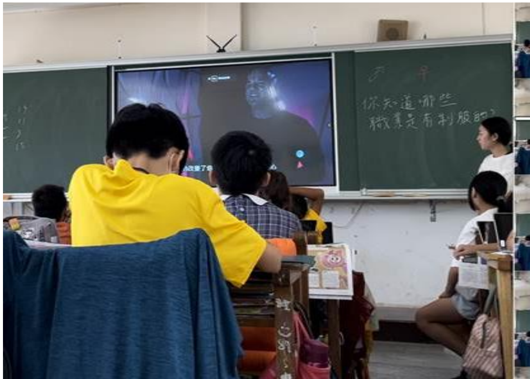
老師播放「標籤」的廣告，學生須完成學習單第 4 題。