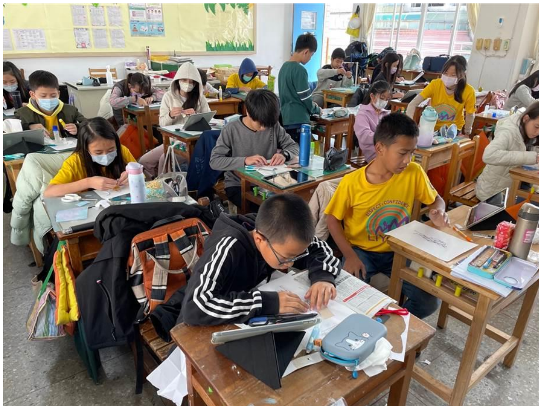
學生們正認真的製作立體服裝畫，使用平板參考 google classroom 的範例。