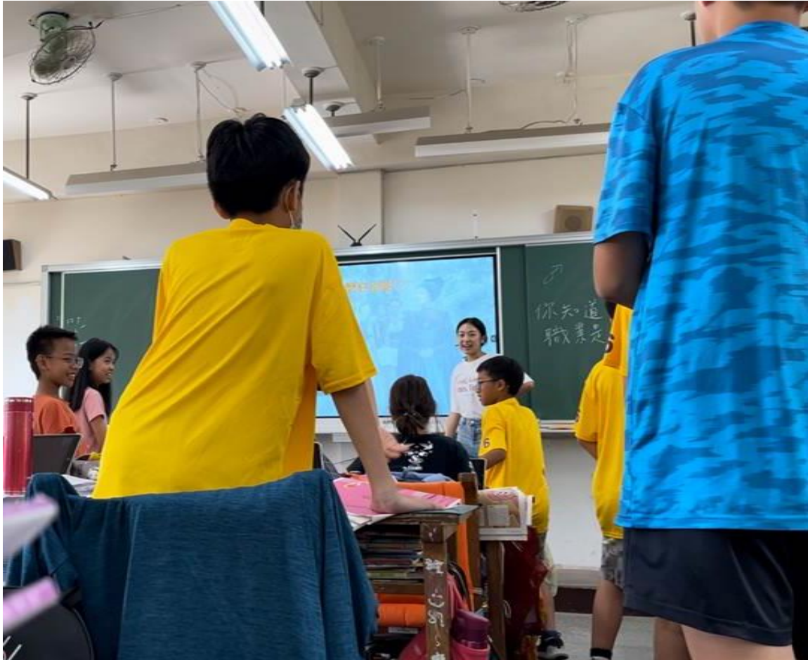
正在進行猜性別的活動。