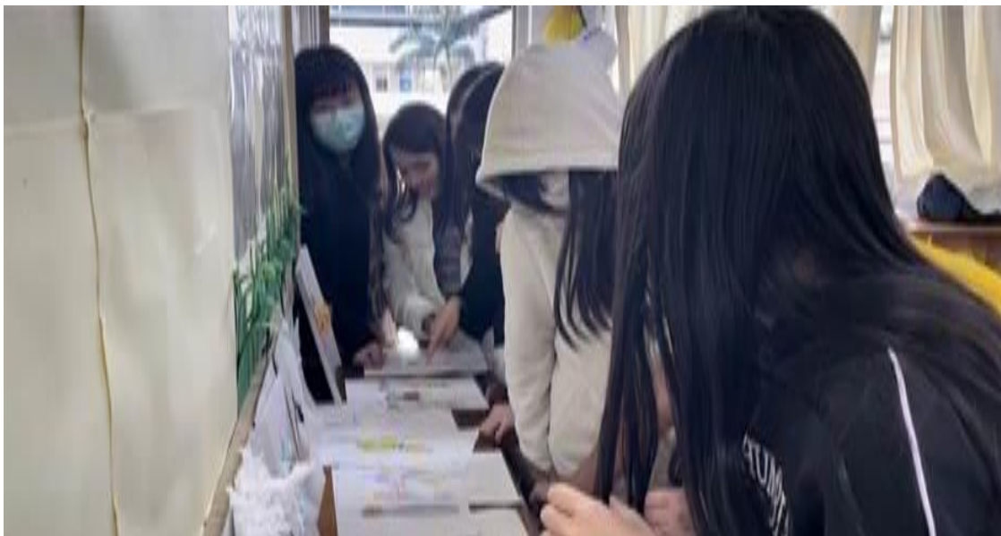
同學彼此觀摩同學的作品。