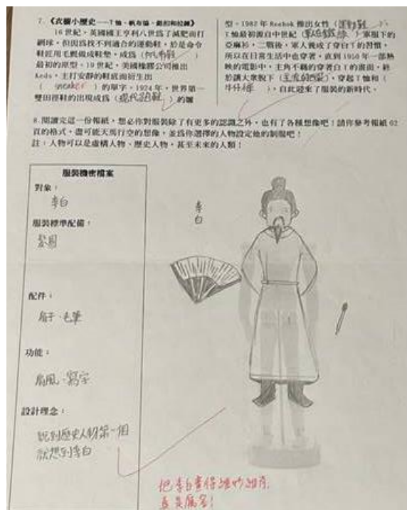
學生自創服裝作品欣賞。