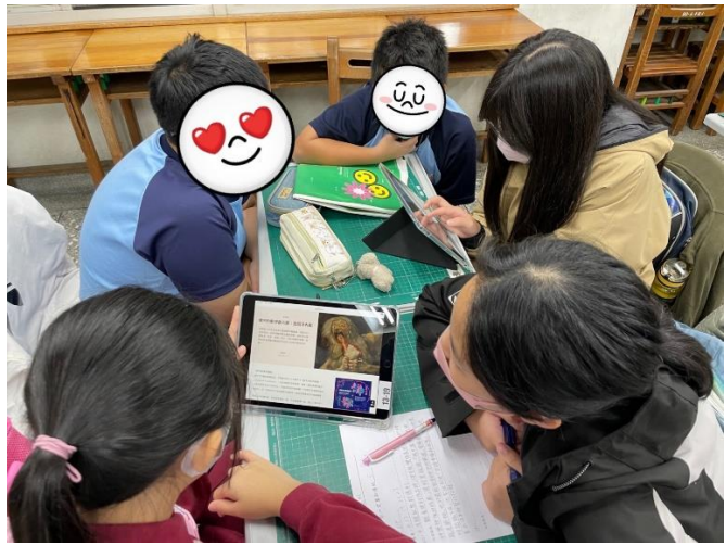
小組利用平板查詢藝術家的相關資料