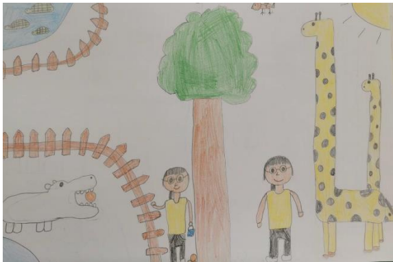
(成為動物園管理者)