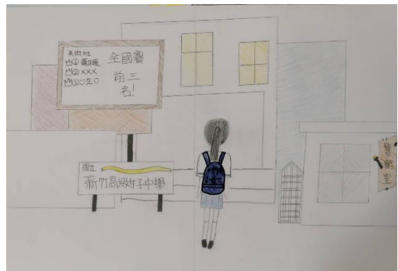
(成為新竹女中美術班學生)