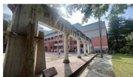
近景 / 仰視