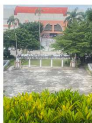
遠景 / 仰視