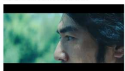
景深：淺 / 構圖：前景 / 視角：平視 前景：人 / 遠景：樹 美的原理原則：對比