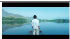
景深：淺 / 構圖：遠景 / 視角：平視 前景：人 / 中景：湖泊 / 遠景：山 美的原理原則：漸變、對稱、調和