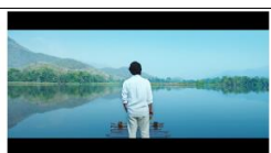
景深：淺 / 構圖：遠景 / 視角：平視 前景：人 / 中景：湖泊 / 遠景：山 美的原理原則：漸變、對稱、調和