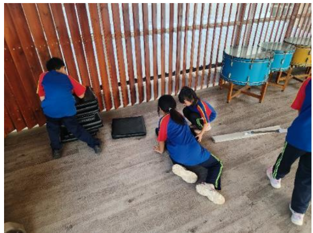
↑課程結束後，不忘將教學場域復原並打掃乾淨，培養學生的公德心。