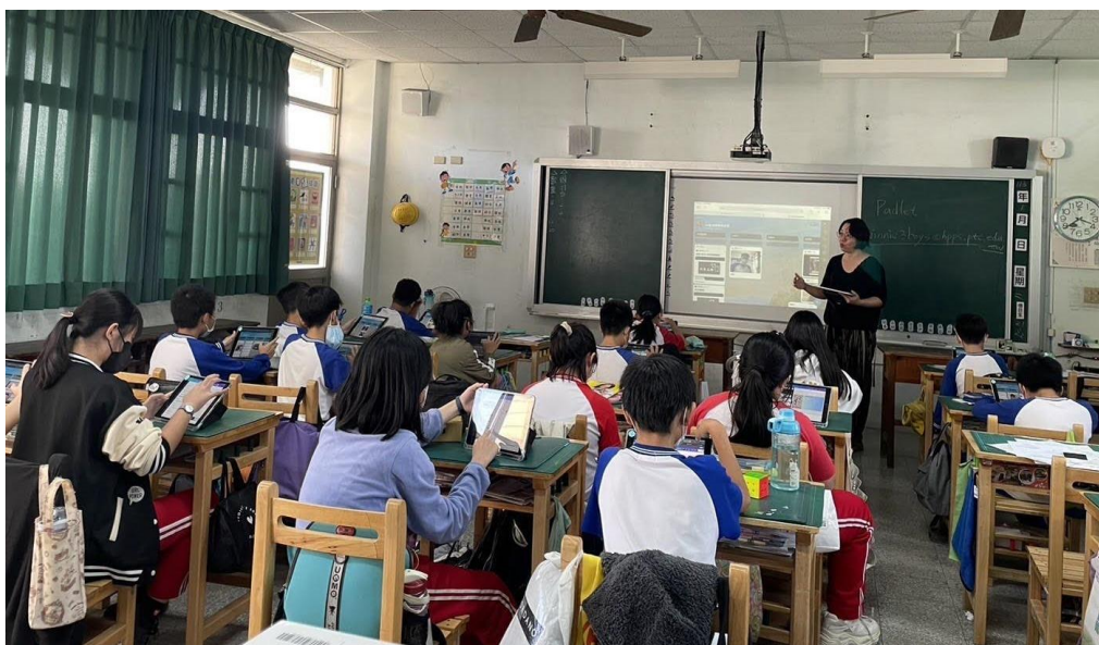
照片 5：指導學生在數位平台上分享