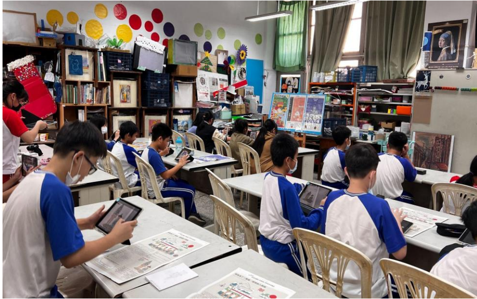
照片 2：學生閱讀安妮新聞冬季特刊並用平板觀看網站