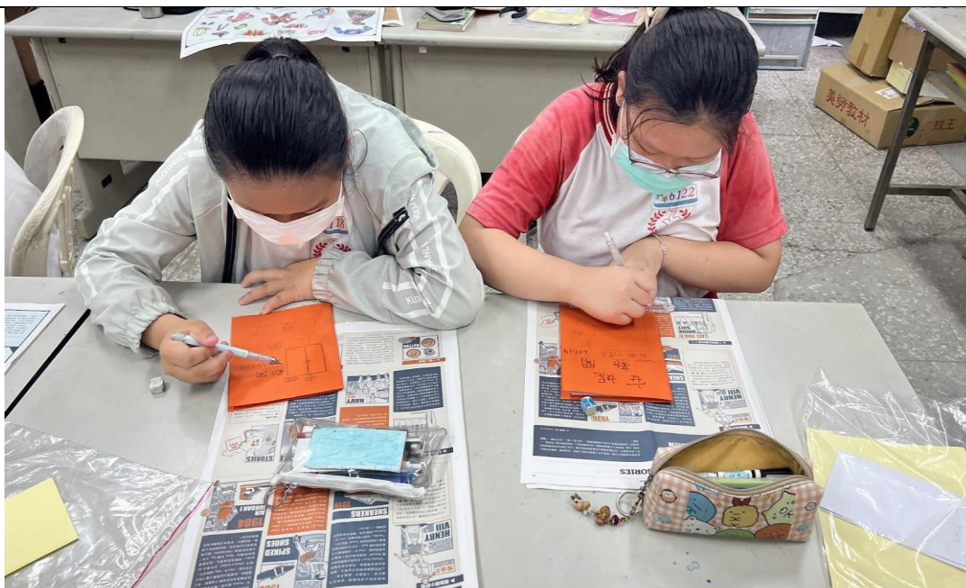
照片 4：繪製繪本小書