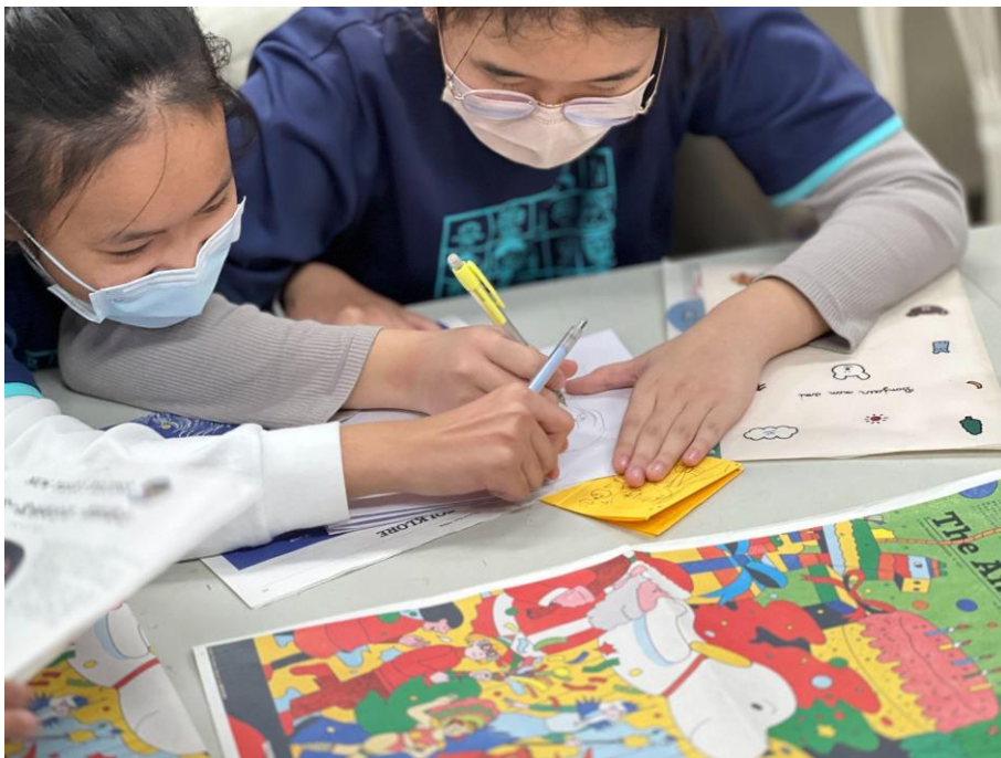
照片 3：學生規劃繪本小書的各頁