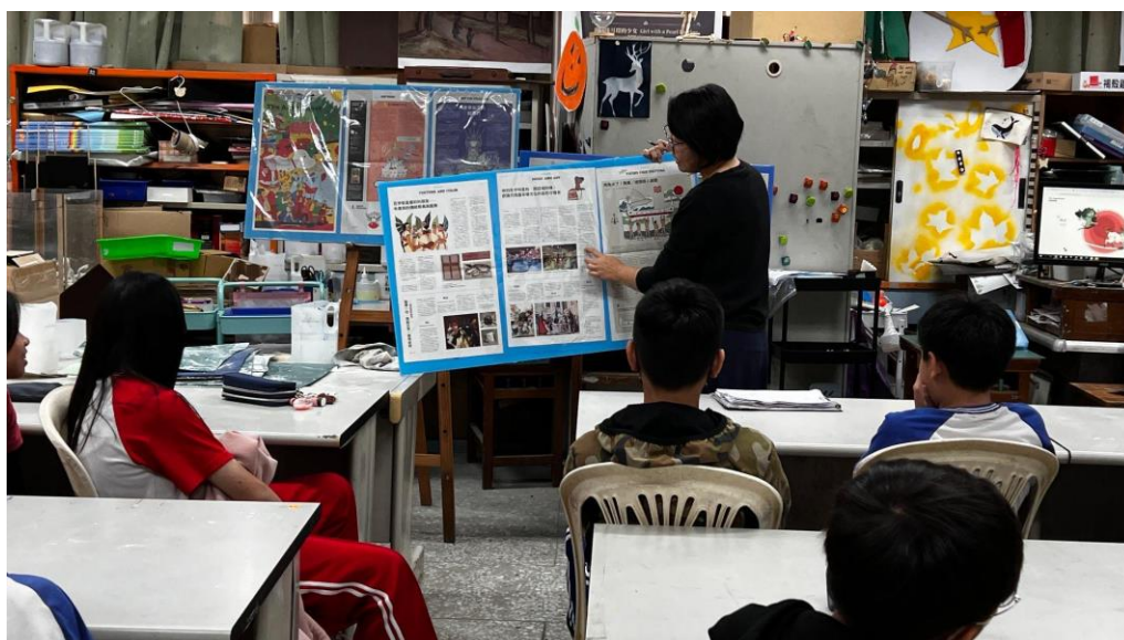
照片 1：簡介安妮新聞刊物內容