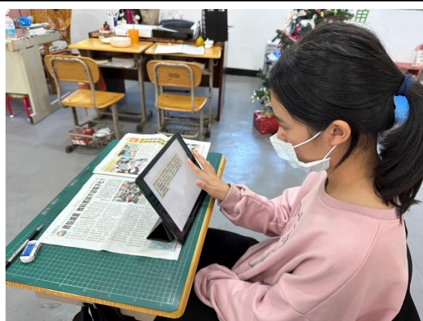
練習閱讀新聞:國語日報周刊作為範例 並使用平板進行筆記