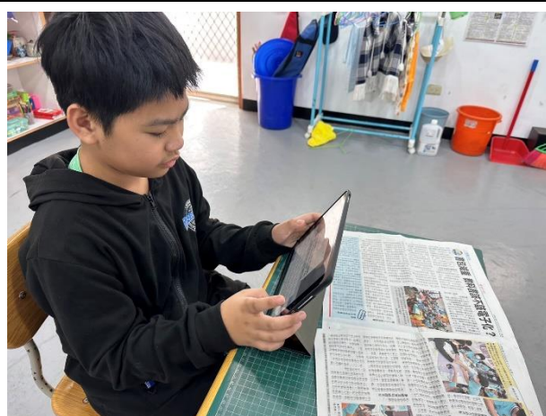
練習閱讀新聞:國語日報周刊作為範例 並使用平板進行筆記