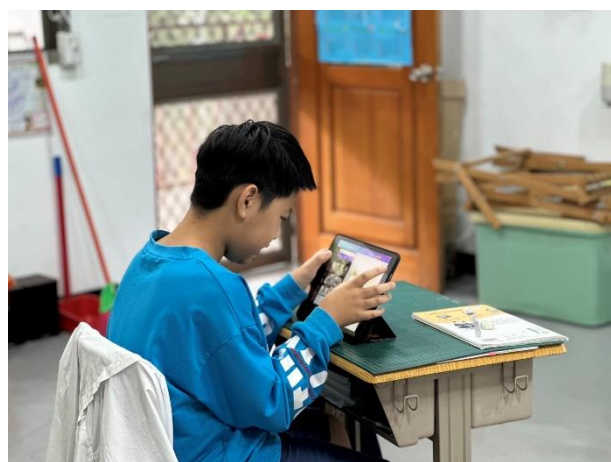
使用 CANVA 製作 slide