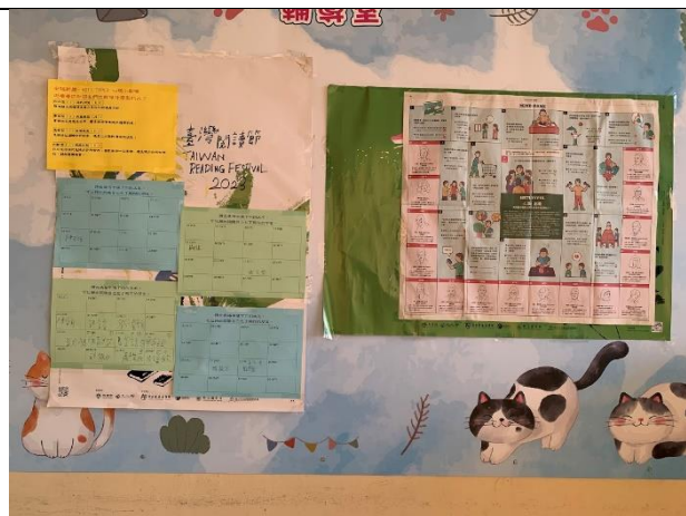
布置心理小劇場於輔導室公佈欄