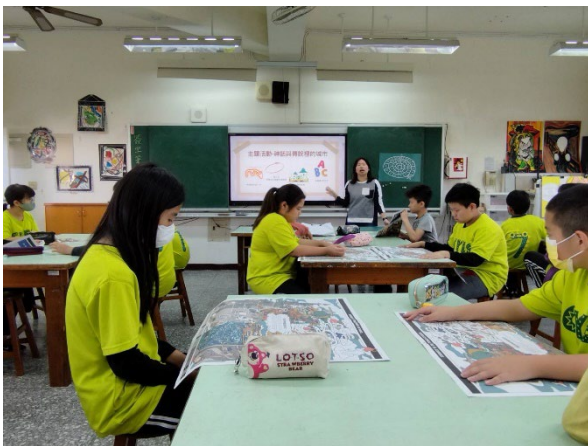
3. 老師說明，學生自己練習找出插圖