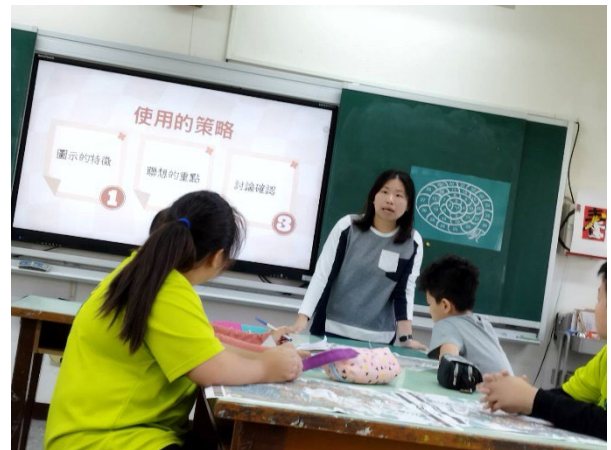
4. 教導使用的策略及方式