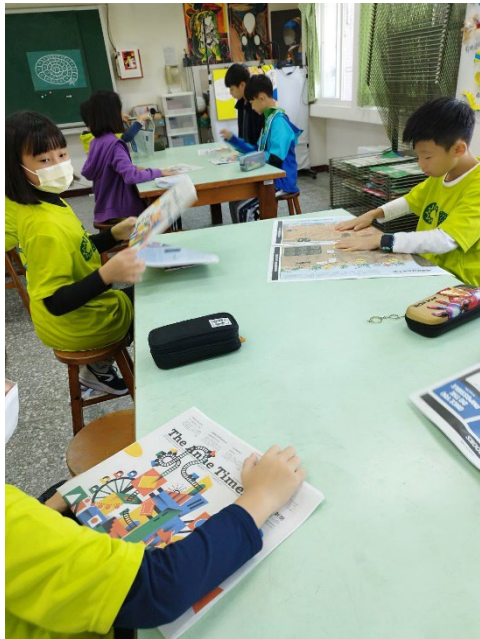
1. 學生認識安妮新聞