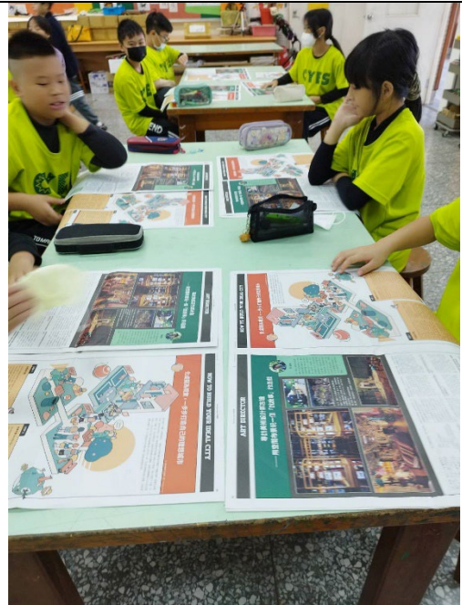
2. 學生說出安妮新聞與其他報紙不同的地方