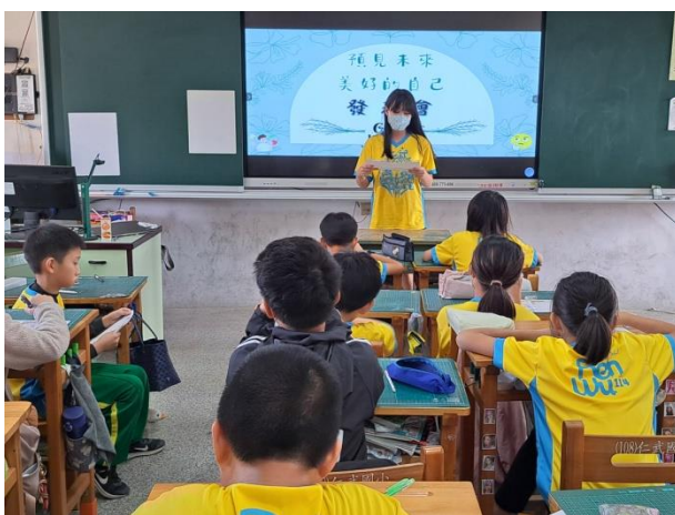
說明：讓孩子說出未來美好的自己