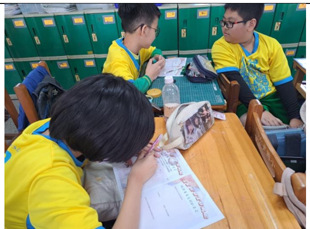
說明：孩子分享、討論並完成學習單