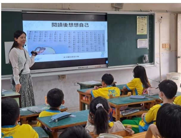
說明：引導孩子想像自己美好的未來