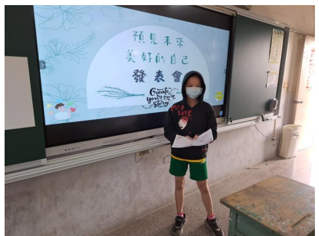
說明：讓孩子說出未來美好的自己