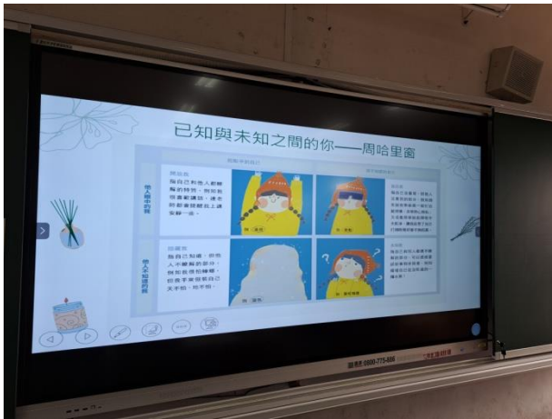
說明：從周哈里窗探索自己