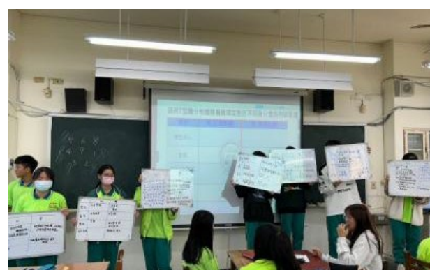
各組對於「用 T 型圖分析廢除服儀規定對於不同身分者的利弊影響」的討論內容。