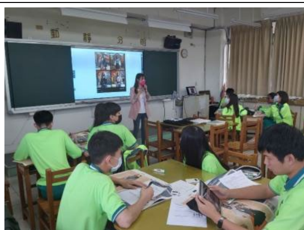
運用 AI 生成軟體繪製自己心中理想的高中制服，並與同學分享。