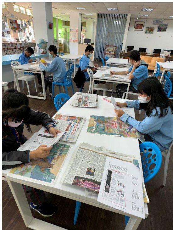
認識報紙：紙質、構成要素