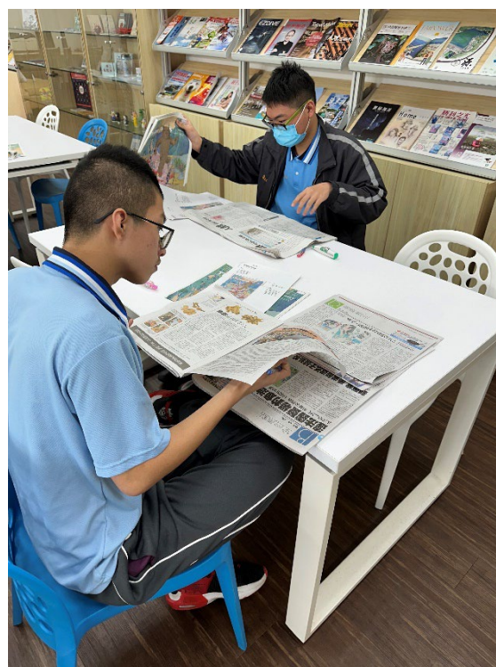
和一般報紙的比較差異