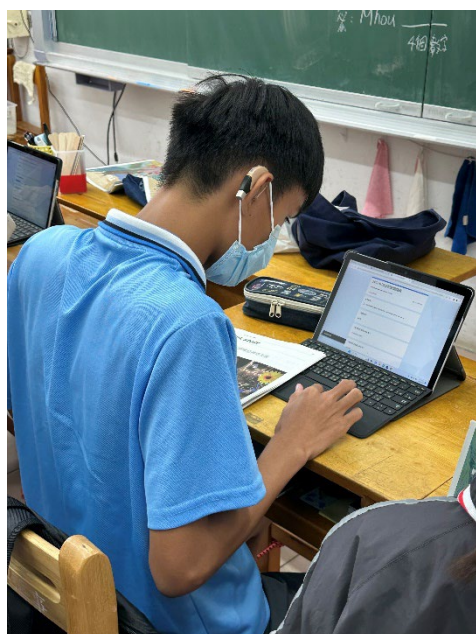
練習找眉標和英打輸入