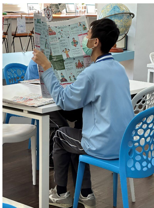
認真閱讀的神情最美