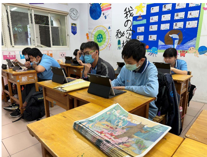
利用平板完成心理測驗再找出類別