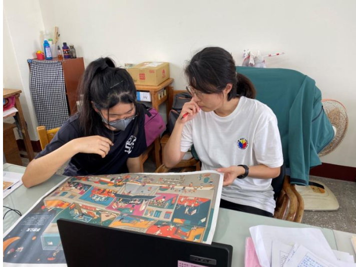
以夢想公寓的圖像為媒介的生涯訪談，師生對話