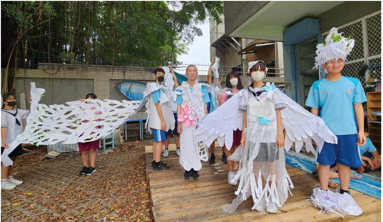
▲ 服裝秀戶外彩排 701 班(森林王國主題)