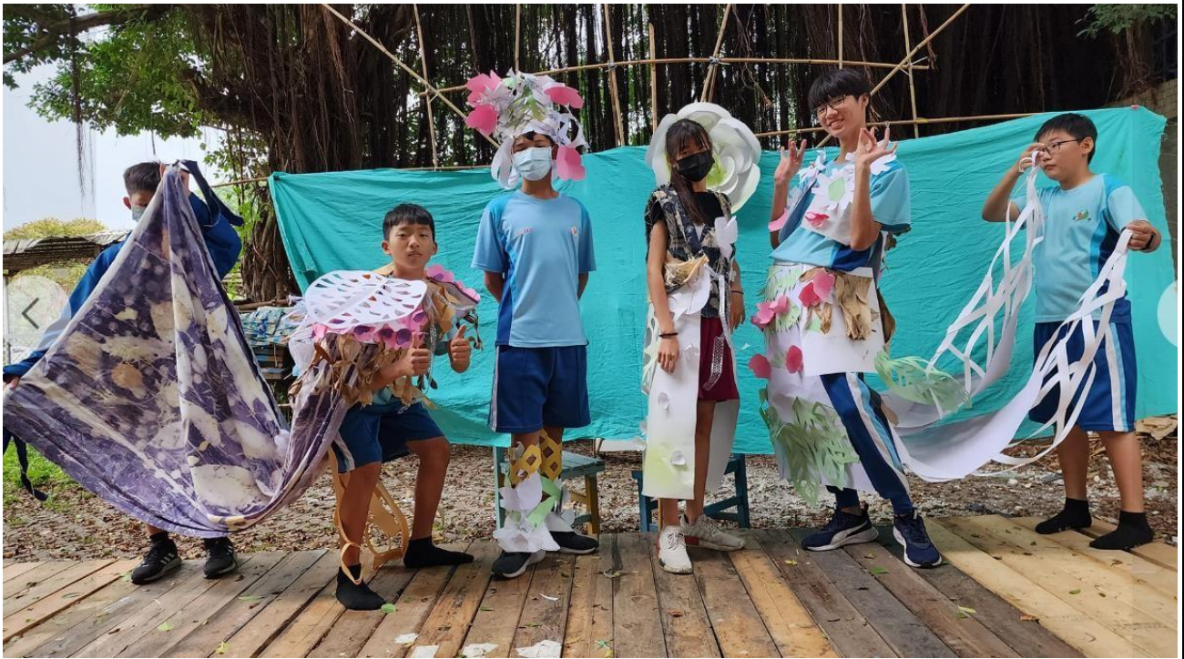
▲ 服裝秀戶外彩排 703 班(四季花獵手主題)