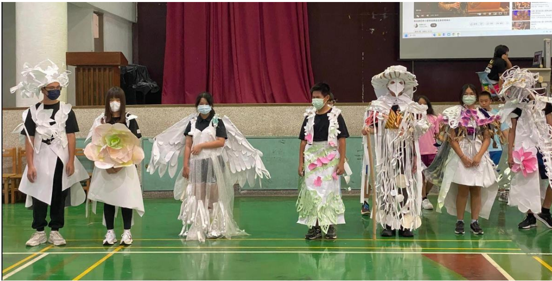
▲ ▼ 成果發表秀，與台東知本國中進行藝術教育交流成果展。