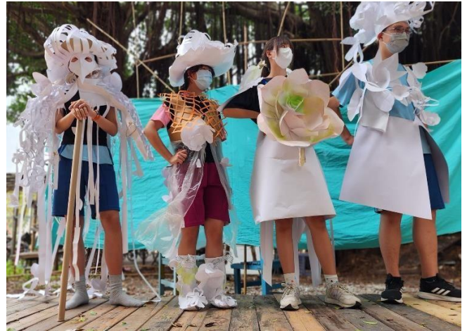
▲ 同一班級，上下學期設計課呈現的品質差異 702 班(花園城堡主題)