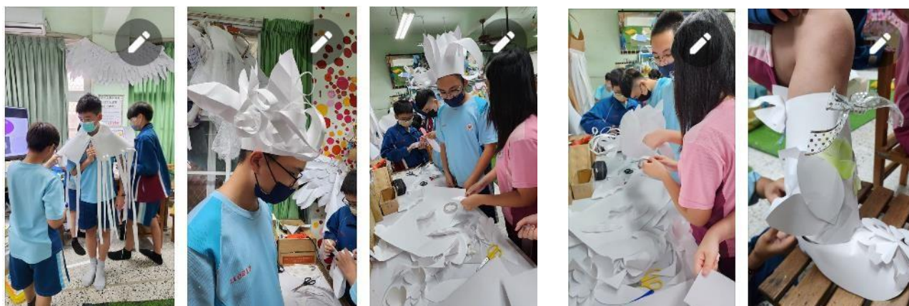
▲ 服裝版型的學習遷移成功應用，披肩，帽子，鞋子的設計應用，全套的服裝就完整了。