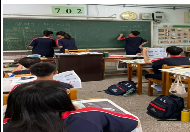
第二組及第三組同學上台分享