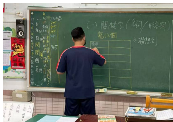
學生寫 12 個關鍵字