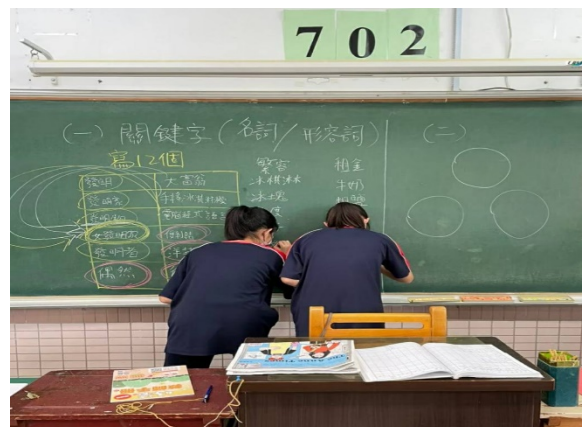
第二組學生到黑板寫關鍵字