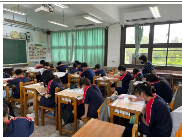
學生細讀安妮新聞文本