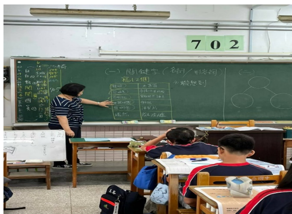
從關鍵字中一起找出三個核心元素