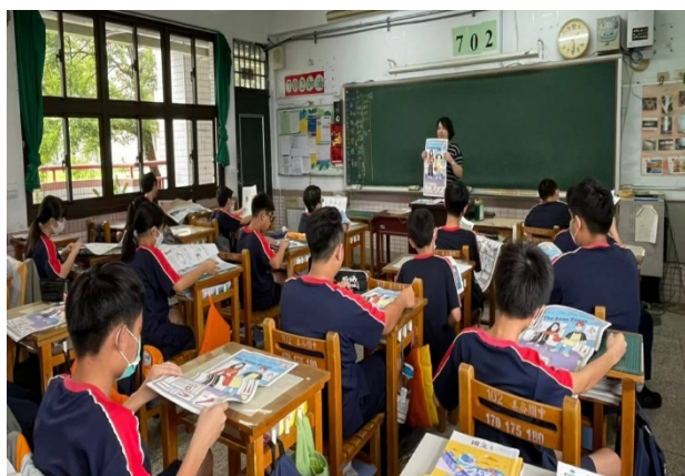
請學生瀏覽個版面