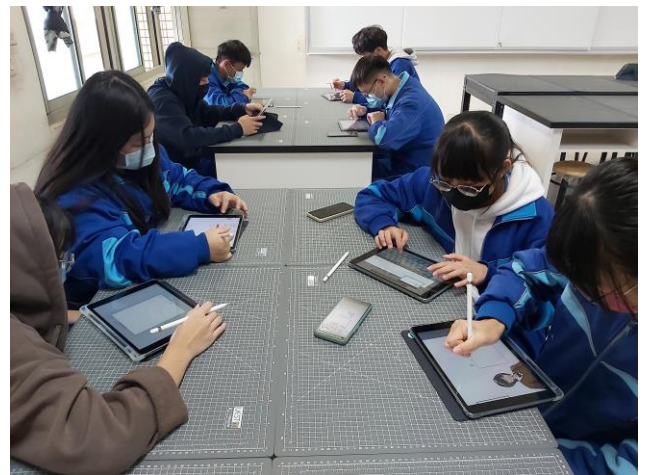
7. 「百工百業影音剪輯」實作