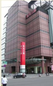
台南 新光三越 有在台南的星光三越裡做過相關的木工工程