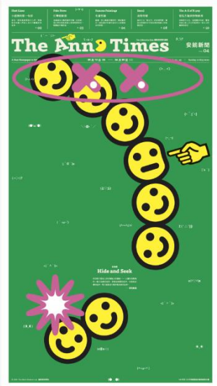
Vol. 04 傳播與溝通