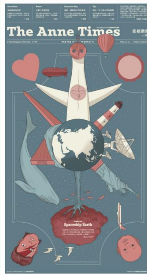
Vol. 03 地球