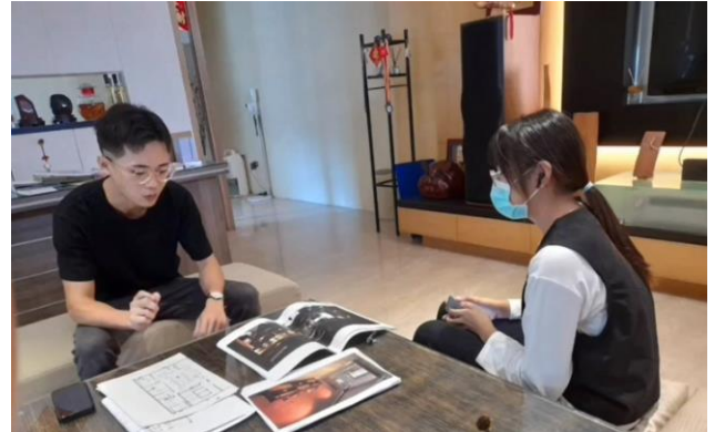
6. 「百工百業專業人士」訪談