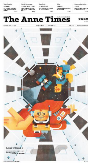
Vol. 01 太空探索