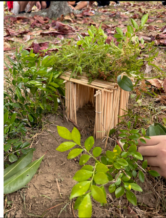
學生作品：綠林小屋