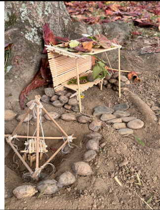
學生作品：我的秘密基地