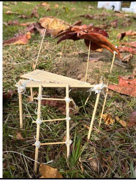
學生作品：竹構工程模型