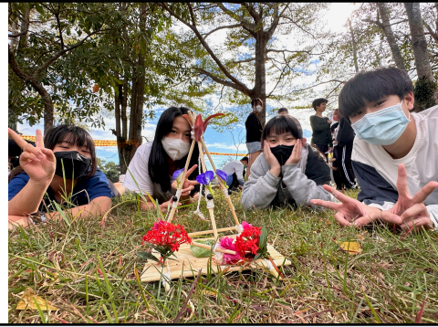
學生作品：自然素材與我的模型