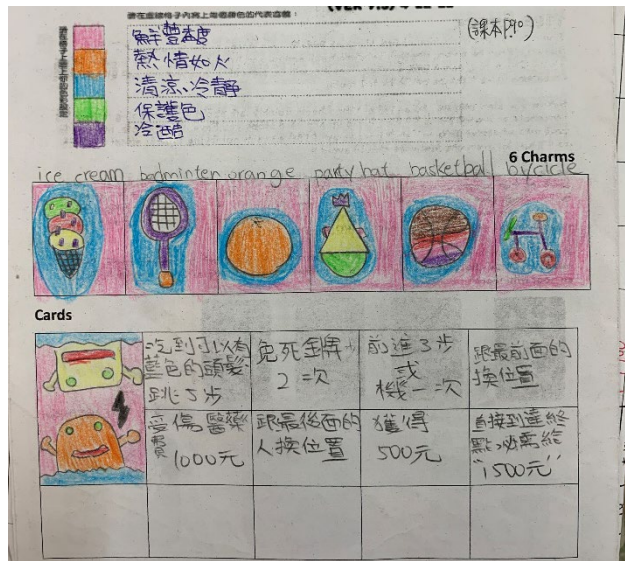
學生的主視覺色盤設計及城市代表物