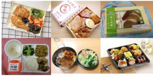
台式便當擺盤與使用的餐具