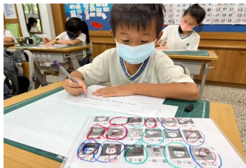
* 彙整性格卡 寫入周哈理窗