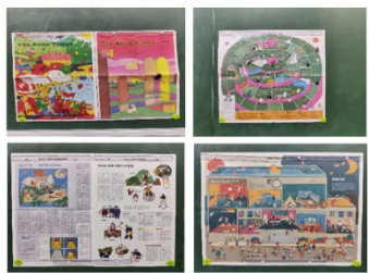
【課程一】認識安妮新聞版面。