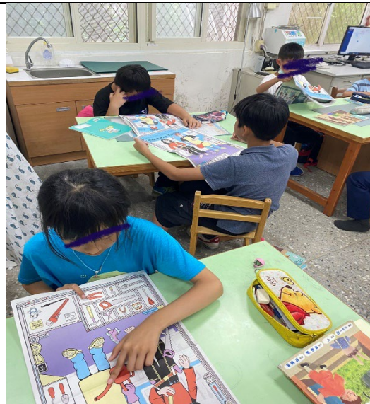
學生認真找出自己有興趣及聯想的職業名稱