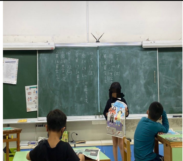
學生 C 上台發表