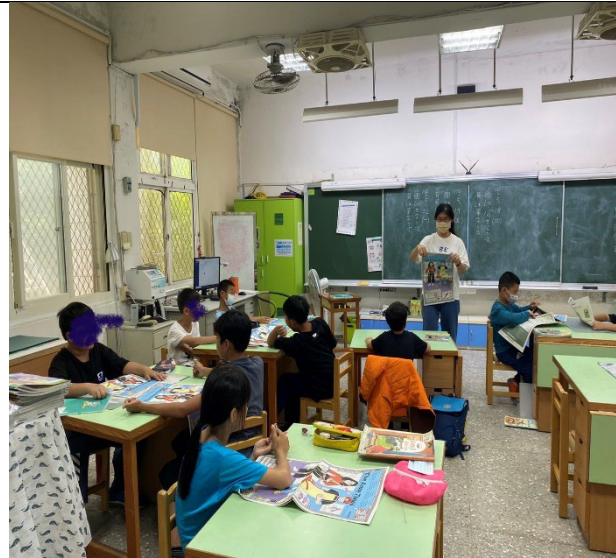
教師先示範說明，之後讓學生輪流上來分享