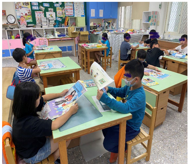
學生互相分享自己聯想到的職業名稱