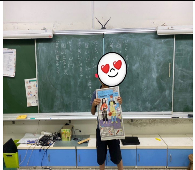
學生 A 上台發表