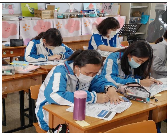
書寫安妮新聞學習單