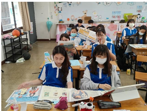
認識安妮新聞的特色