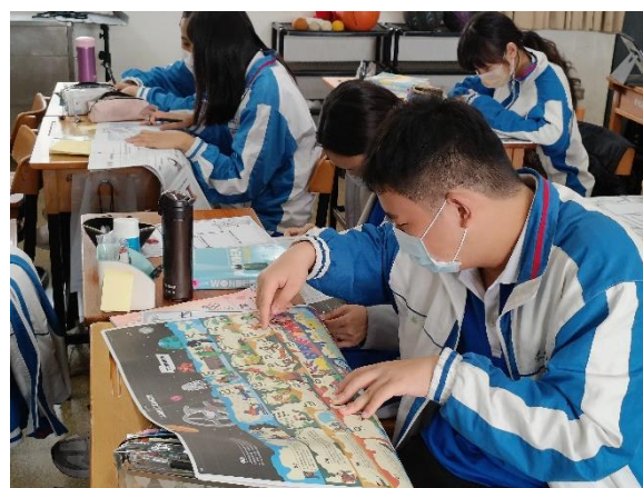
學生閱讀安妮新聞