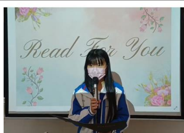
上台朗誦文章段落