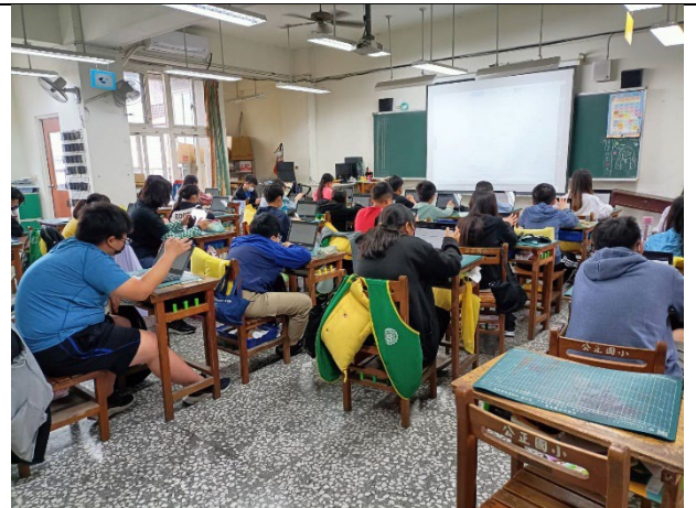
因為對於自己有了不一樣的認識，對於夢想也有了不一樣的看法