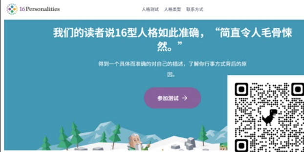
人格測試了解自己的優勢與限制