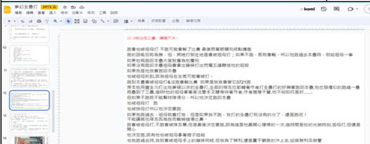
內容深究後回應相關提問，並進行聲聲交流。