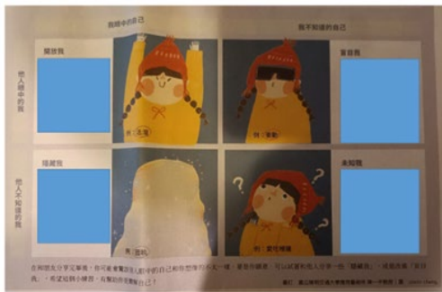
除了自己原來的視角，想一想其他的視角