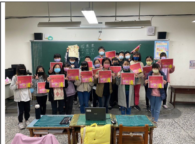
認識安妮報紙的版面