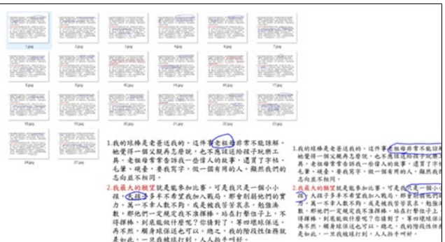
聯繫課文棒球英雄夢探究主角的夢想實踐之路