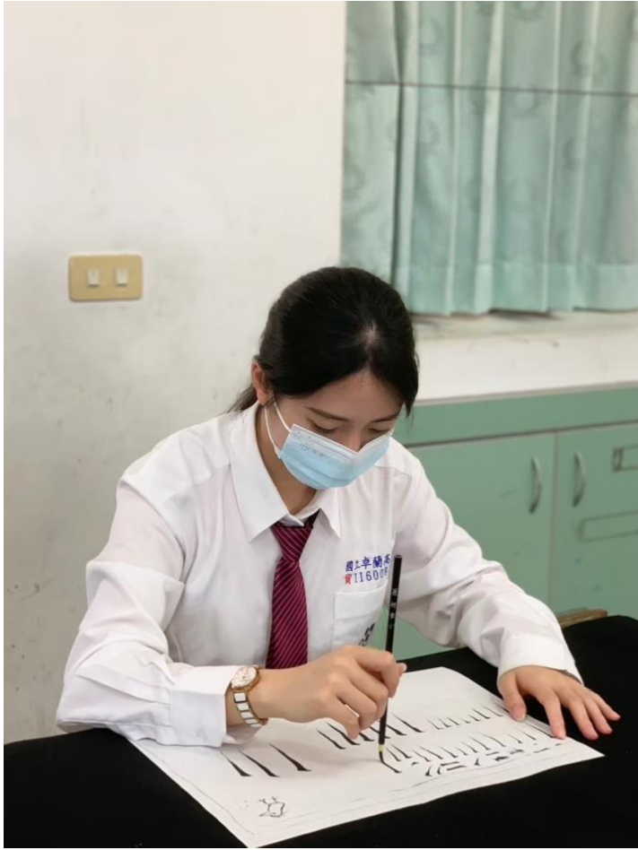
第七週：工筆白描練習