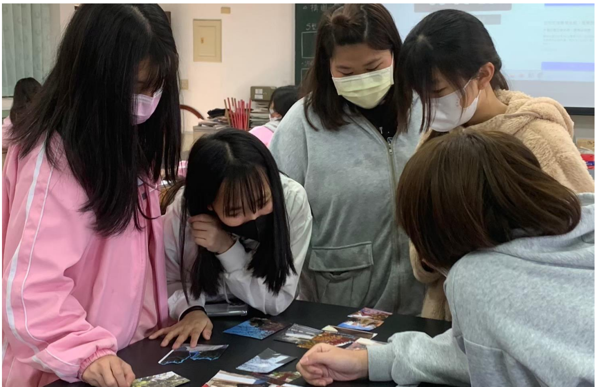
第五週：學生將三種視角的校園攝影照片，進行移動視點的空間安排。