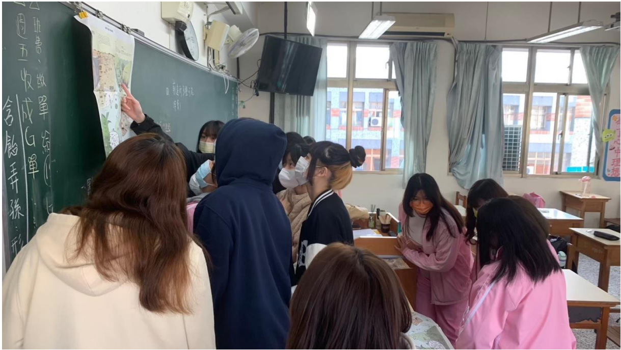
第一週：「前進的多種可能—安妮新聞雜誌」