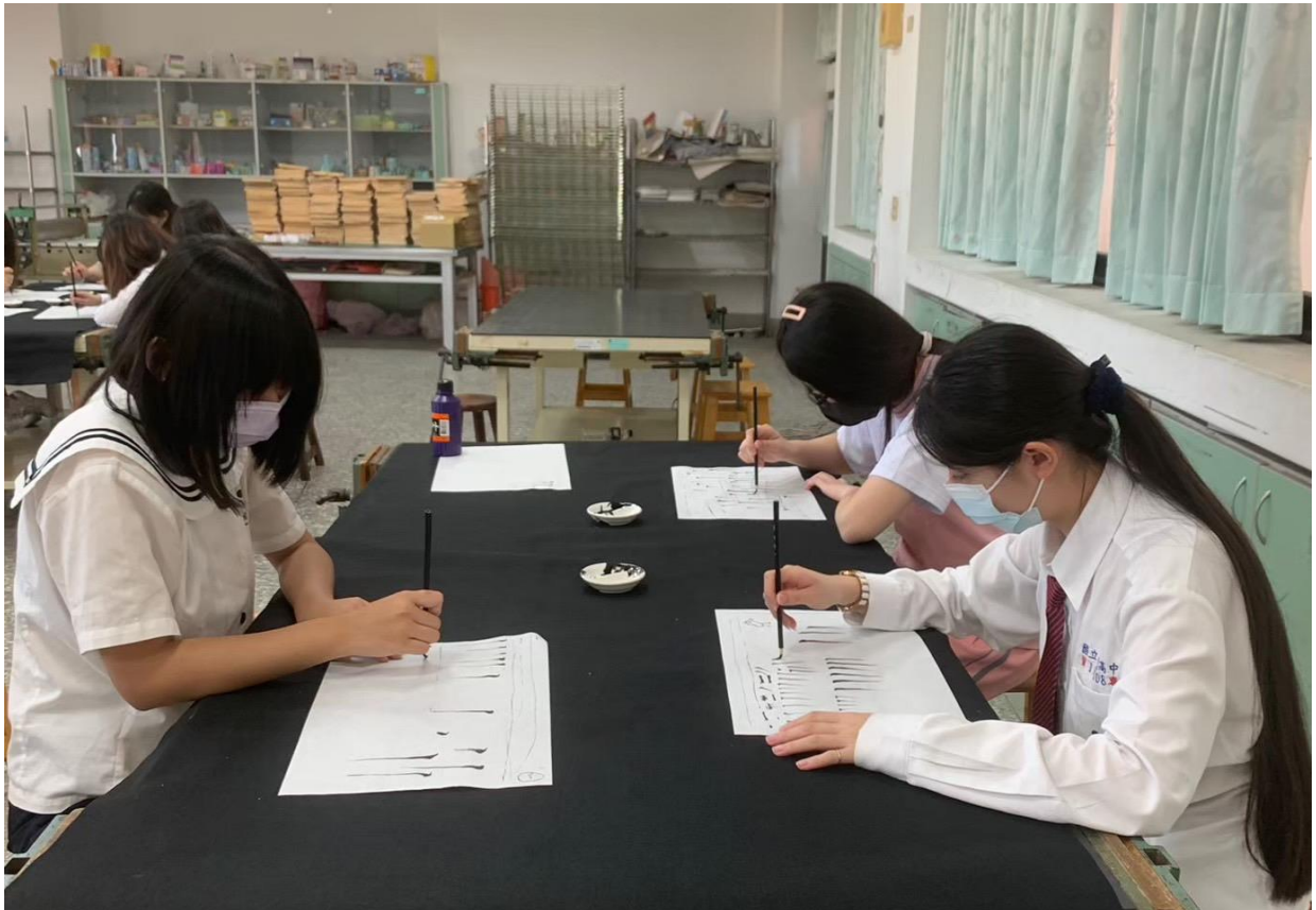
第七週：工筆白描練習