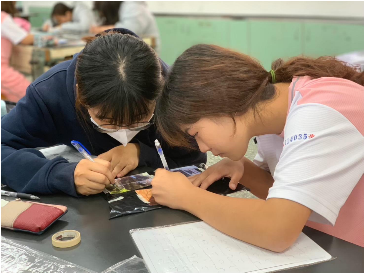
第五週：學生將三種視角的校園攝影照片描繪於拼圖中。