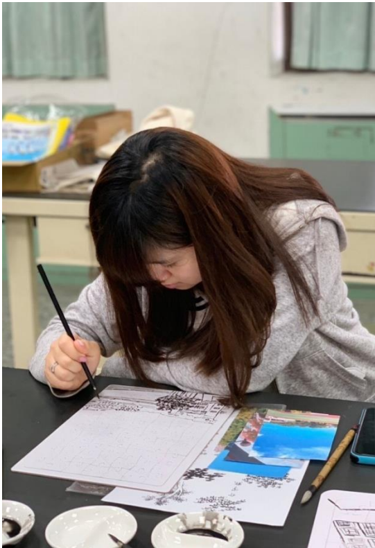
第八週：拼圖創作(經營位置、骨法用筆.....)