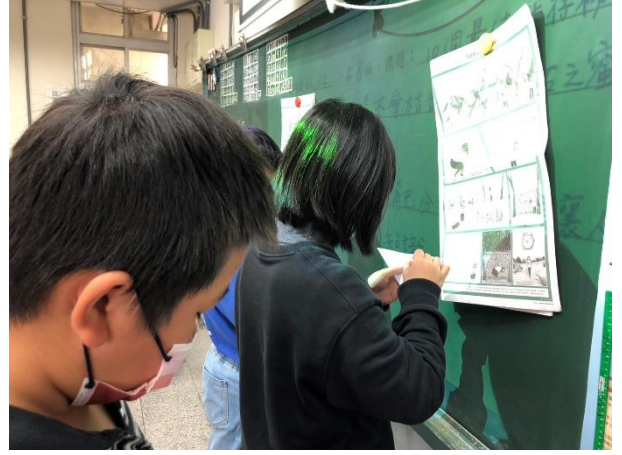
求生祕訣—實作摺紙杯