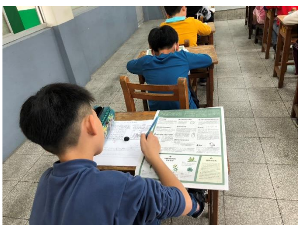
寫下印象深刻的報導內容