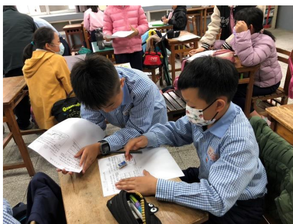
兩兩分享與討論學習單