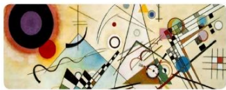
Chapter 4 [ 構成 ]